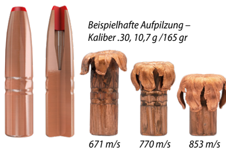
Beispielhafte Aufpülzung – Kaliber .30, 10,7 g / 165 gr