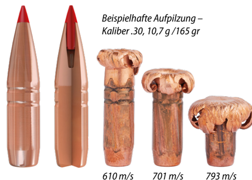
Beispielhafte Aufpülzung – Kaliber .30, 10,7 g / 165 gr