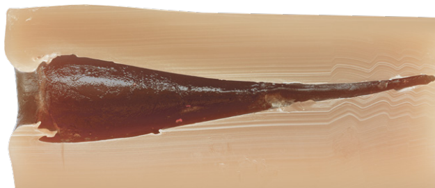
Zielentfernung: 100 m