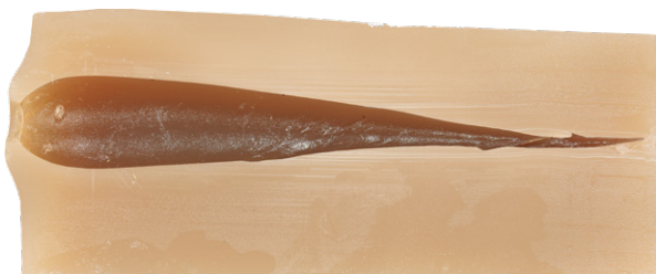
Zielentfernung: 50 m