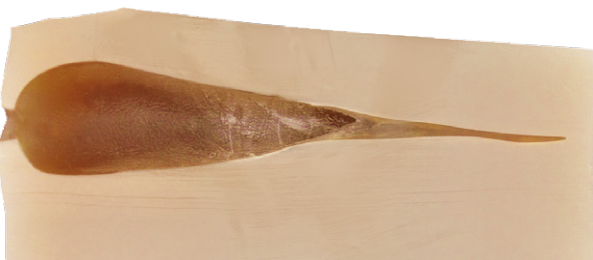
Zielentfernung: 100 m