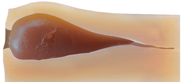
Zielentfernung: 100 m