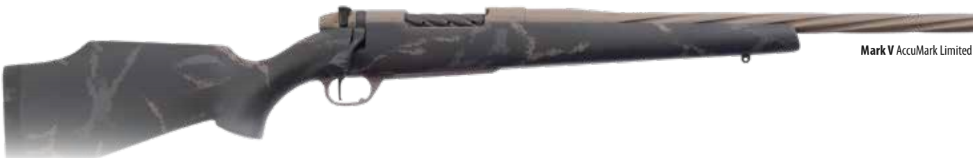
Mark V AccuMark Limited